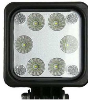
Światło robocze pod platformą