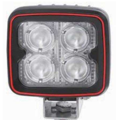
Dodatkowe reflektory z tyłu (2 sztuki)