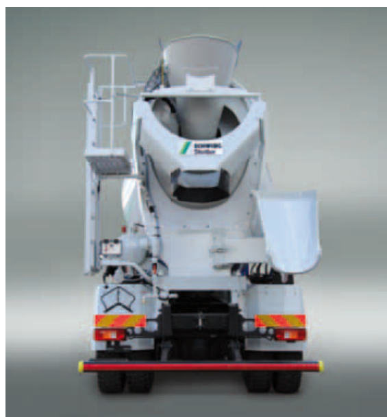
Duża przestrzeń do podawania betonu dla dużych pojemników dźwigu lub silosów