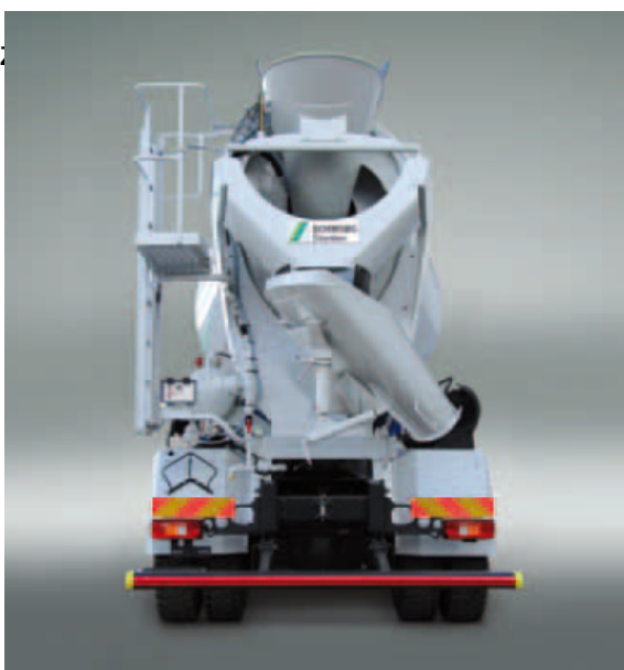
Rynna od długości 1,450 mm ułatwia wylewanie betonu do kosza pompy do betonu.